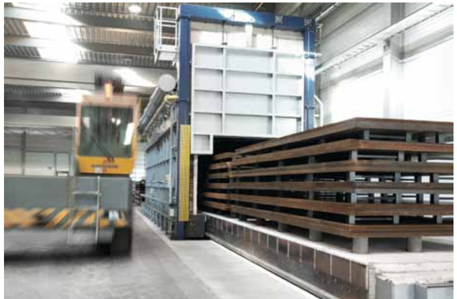
Das Material wird bei Meusburger in eigenen Glühöfen 24 Stunden lang spannungsarm gegläht.

Ähnlich herausfordernd ist die Spezifikation einer Spannvorrichtung für ein Spezial-Bearbeitungszentrum zur Verwendung im Automobilbau. Das 1.200 x 180 x 140 mm große Stück aus C45 erhält in ca. 30-stündiger Bearbeitung zahlreiche Schrägen und Tieflochbohrungen.